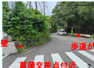
擁壁 → 歩道がない 菖蒲交差点付近 2/5

同地区では菖蒲13号線及び14号線の改良工事を進めているため、事業化はその後の検討となるが、安全対策として繁茂していた草刈りを実施したので、今後も注視していきたい。