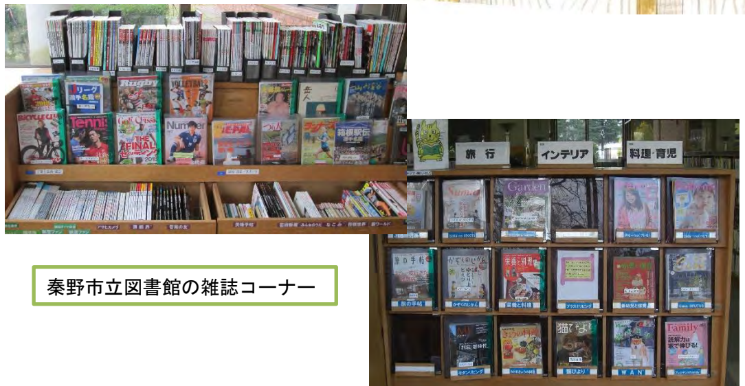
秦野市立図書館の雑誌コーナー